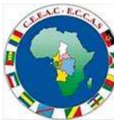
table ronde du 26 au 28 novembre à Libreville, au Gabon, afin de poursuivre le travail sur son concept civil débuté en juillet 2011 à Kinshasa avec l'appui du ROP et du Centre Pearson. Regroupant des participants issus des États membres de la

"Nouveaux acteurs de la paix et de la sécurité dans le multilatéralisme" lancent un appel à contribution pour la 8e Conférence pan-européenne de Relations internationales qui se tiendra à Varsovie du 18 au 21 septembre 2013. Cet appel porte sur l'axe thématique "Understanding cooperation in peace processes : Diversity of actors, unity of action ?". La date butoir pour soumettre une proposition est le 13 janvier 2013.