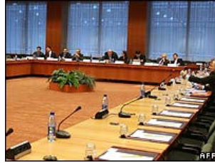
Les négociateurs ont échoué à trouver un compromis sur le statut du Kosovo

La Mission d'administration intérimaire des Nations unies au Kosovo (MINUK) est en place depuis plus de huit ans maintenant et joue un rôle central dans les négociations actuelles sur le statut de ce territoire, négociations qui doivent aboutir le 10 décembre 2008. Novatrice sous bien des aspects, jamais une mission de l'ONU n'avait été investie de pouvoirs aussi vastes concernant l'administration d'un territoire et d'une population.