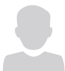
RIEK MACHAR – CHEF DU SPLM/A (OPPOSITION)